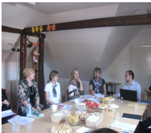
Edukacija članova mobilnog stručnog tima

Procjenu trajanja i učestalosti ove usluge vrši Stručni tim Centra.